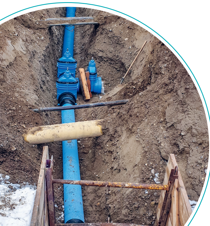
Bild: Neue Wasser-Abzweigung Richtung Lyss beim Leimern-Areal.

Mit Hochdruck wurde die vorhandene Wasserleitung zwischen Spins und Galvaswiss durch eine neue Verbindungsleitung ersetzt. Die verlegte Leitungslänge betrug 920 Meter, wobei der Durchmesser der Verbindungsleitung zwischen 250mm und 300mm betrug. Die leistungsstarke Leitung bildet ein zweites Standbein für die durch den Kanton vorgegebene Grundlage für eine sichere Wasserversorgung in Aarberg. Damit ist der erforderliche Wasseraustausch zwischen Lyss und Aarberg sichergestellt.