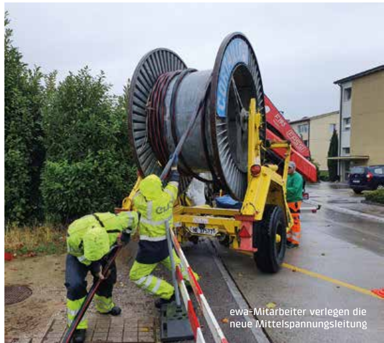
ewa-Mitarbeiter verlegen die neue Mittelspannungsleitung

Wir sind überzeugt, dass die Massnahmen dazu führen, ab sofort einen normal beleuchteten Radweg an der alten Lysstrasse zu haben.